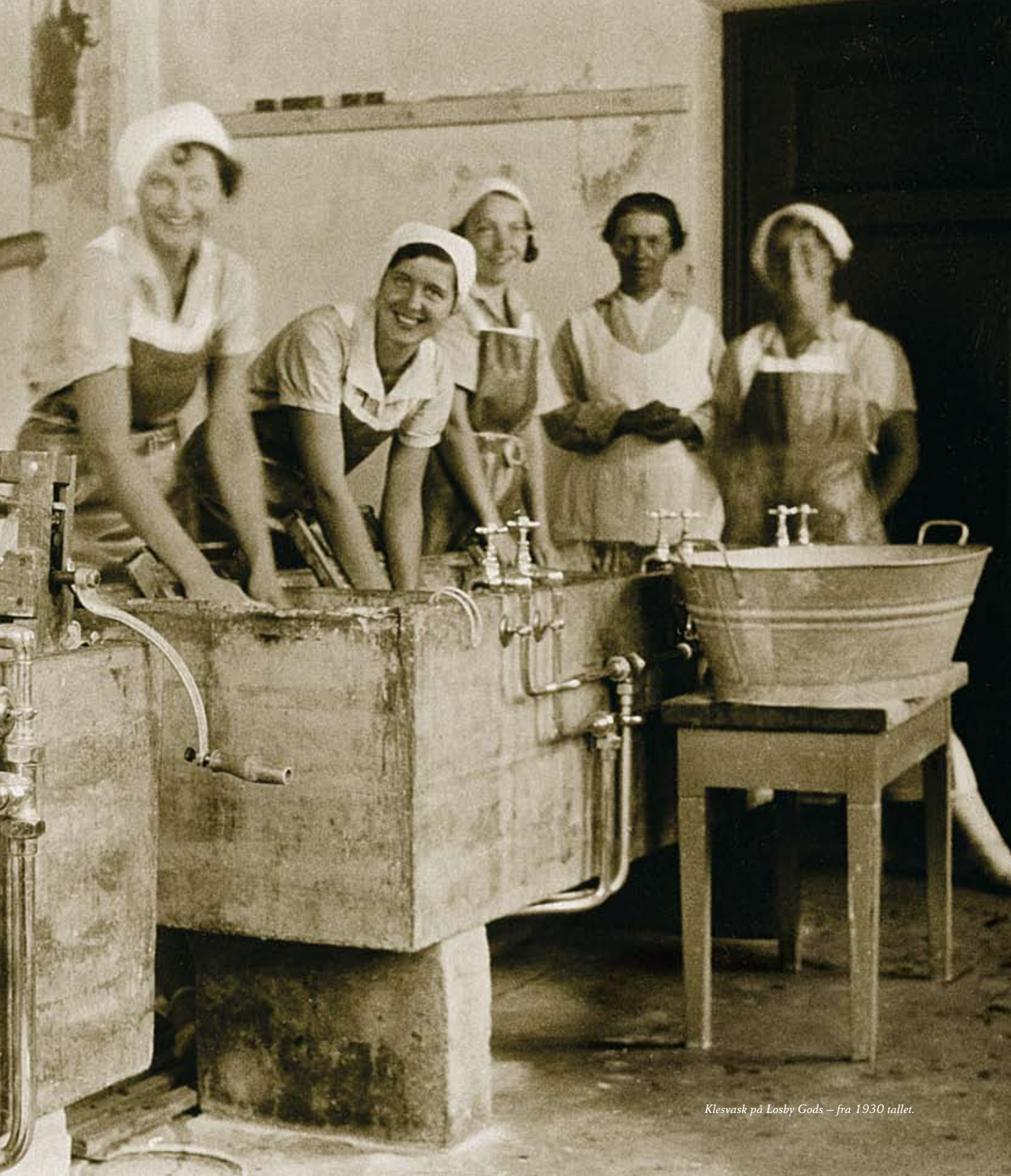
Klesvask på Losby Gods – fra 1930 tallet.