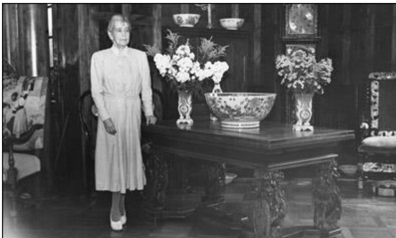
Bildet er tatt i 1953 da Norsk Folkemuseum var på besøk. Fruen er 84 år gammel her.