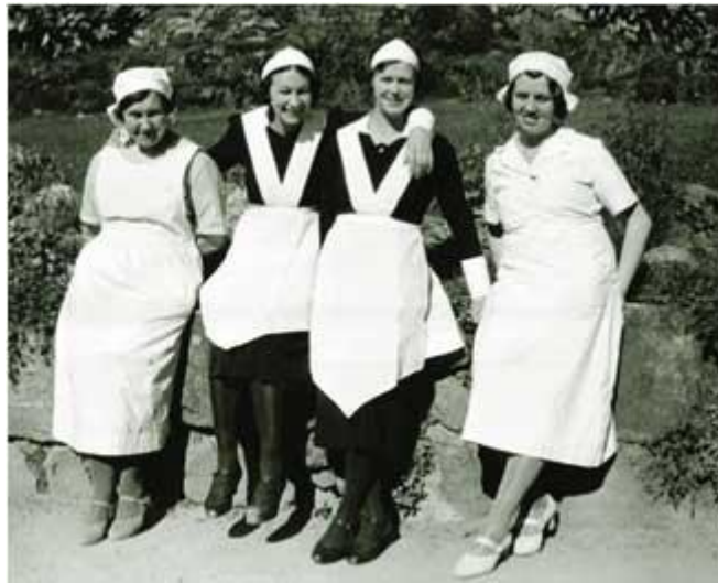
To kokker og to stuepiker fra Losby Gods. Bildet er tatt ca 1940.

Etter krigen var "Fruen" både sliten og ensom, og økonomien var blitt vesentlig dårligere. Både jordbruk og sagbruk hadde blitt tunge bedrifter å drive, særlig fordi lite eller ingen investering var gjort for å modernisere bruket. Men hun var fullt bestemt på å holde fasaden og videreføre den storhetstid som Losby hadde hatt i så mange år når hennes mann hadde levd.