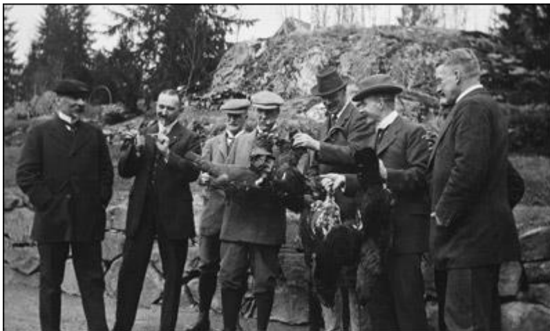
Fine herrer i munter passiar etter end "rype-jakt"

Det unge godseierparet var meget gjestfrie og med sin gunstige beliggenhet like ved hovedstaden, ble det staselige godset snart sentrum for et glitrende og sangomsust selskapsliv. Hit kom medlemmer av Christianias beste borgerskap og fremstående representanter for diplomatiet. Som kjent var jo selve Kong Haakon VII en hyppig gjest. En av de to store selskapsesongene var jakttiden. Jaktterrenget rundt godset inviterte til ypperlige forhold for fintfolk som ville "underholdes" med litt natur og spenning. Her var elg, rådyr, hare og storfugl i fleng, og ingen andre hadde jakttilgang på det enorme skogsområdene til godseieren. Jaktselskapene var en tradisjon som startet tidligere enn godsets 155 års lange historie.