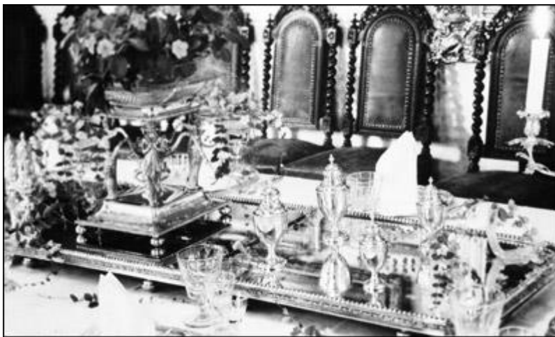
En av Losbys storslåtte sølvdekorasjoner. Fra havestuen ca 1920.