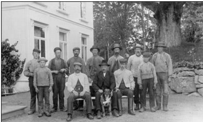
Arbeidsfolk fra sagbruket, utenfor godset. Fra slutten av 1800 tallet.

Losby klarte seg bra gjennom både depresjonen, og to verdenskriger så det var en trygghet i det å ha en jobb å gå til hver dag, og et stabilt miljø. Dette var nok også årsaken til husmennenes og tjenestefolkets lojalitet.