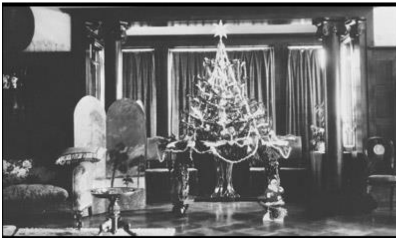
Biblioteket pyntet til jul

Biblioteket ble det nye fest rommet på godset. Losby Gods hadde tradisjonsrike julefester hvert år, og det ble ikke spart på noe til denne høytiden. Biblioteket var hjertet av feiringen og det var her den store julegranen ble dekorert og overdådig pyntet. Tjeneste pikene fikk lov til å sitte på trappa, inn til biblioteket og se på når de åpnet pakker og danset rundt juletreet. Når de hadde sittet der en liten stund var det tilbake på arbeid. Dette var meget storsinnet av herskapet, og ble ansett som usedvanlig vennligsinnet. Noe tjenestefolket satte stor pris på.