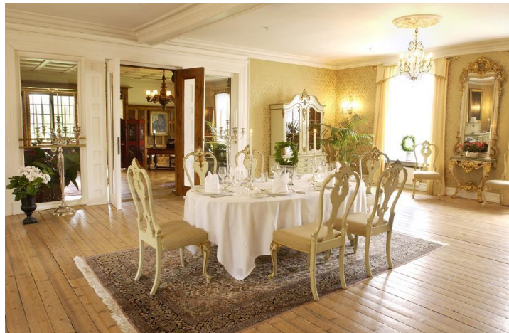
Slik ser ballsalen ut i dag, etter renoveringen

Gardinene i ballsalen er også spesialsydd for å ligne mest mulig på originalen. Bildene fra Norsk Folkemuseum har vært spesielt hjelpsomme i dette rommet.