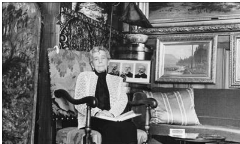
Fruen, 84 år gammel, i herresalongen.

Gulvet i Herresalongen er i likhet med de andre rommene originalt, vi fant det under vegg til vegg teppet som lå her. Gulvet har en mørk brunfarge som en ramme rundt hele gulvdekket, samt en mørk brun stjerne i midten under lysekronen. Det er uvisst hvordan dette gulvet er laget, og hvorfor det er slik det er. Det er funnet lignende gulv i andre gods fra samme tidsepoke.