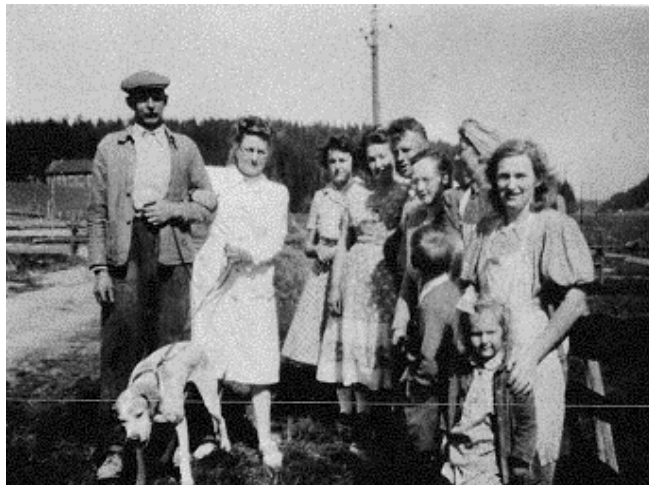
En husmann med familie i Losby dalen

Uthusene er som regel satt opp i bindingsverk.